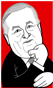
Par ALAIN DUHAMEL